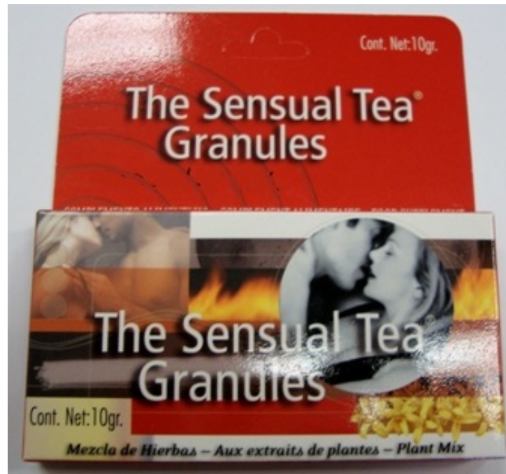
Fig. 3: Imagen del envase del producto THE SENSUAL TEA GRANULES granulado