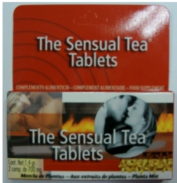
Fig. 2: Imagen del envase del producto THE SENSUAL TEA TABLETS comprimidos